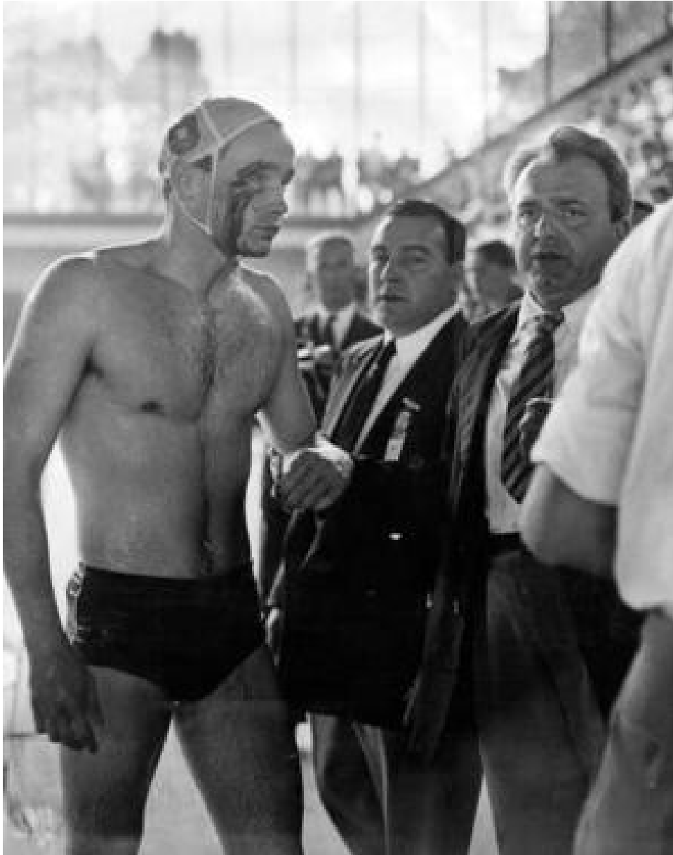
Een Hongaarse waterpolospeler verlaat gewond het zwembad nadat er een vroegtijdig eind is gekomen aan de wedstrijd tegen het Sovjetteam tijdens de Spelen van 1956.