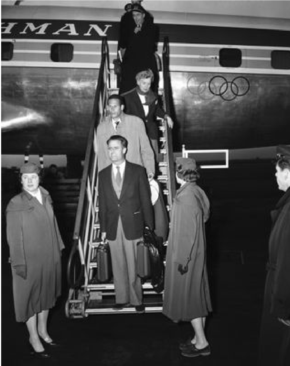
De Nederlandse delegatie keert onverrichter zaken terug uit Melbourne.