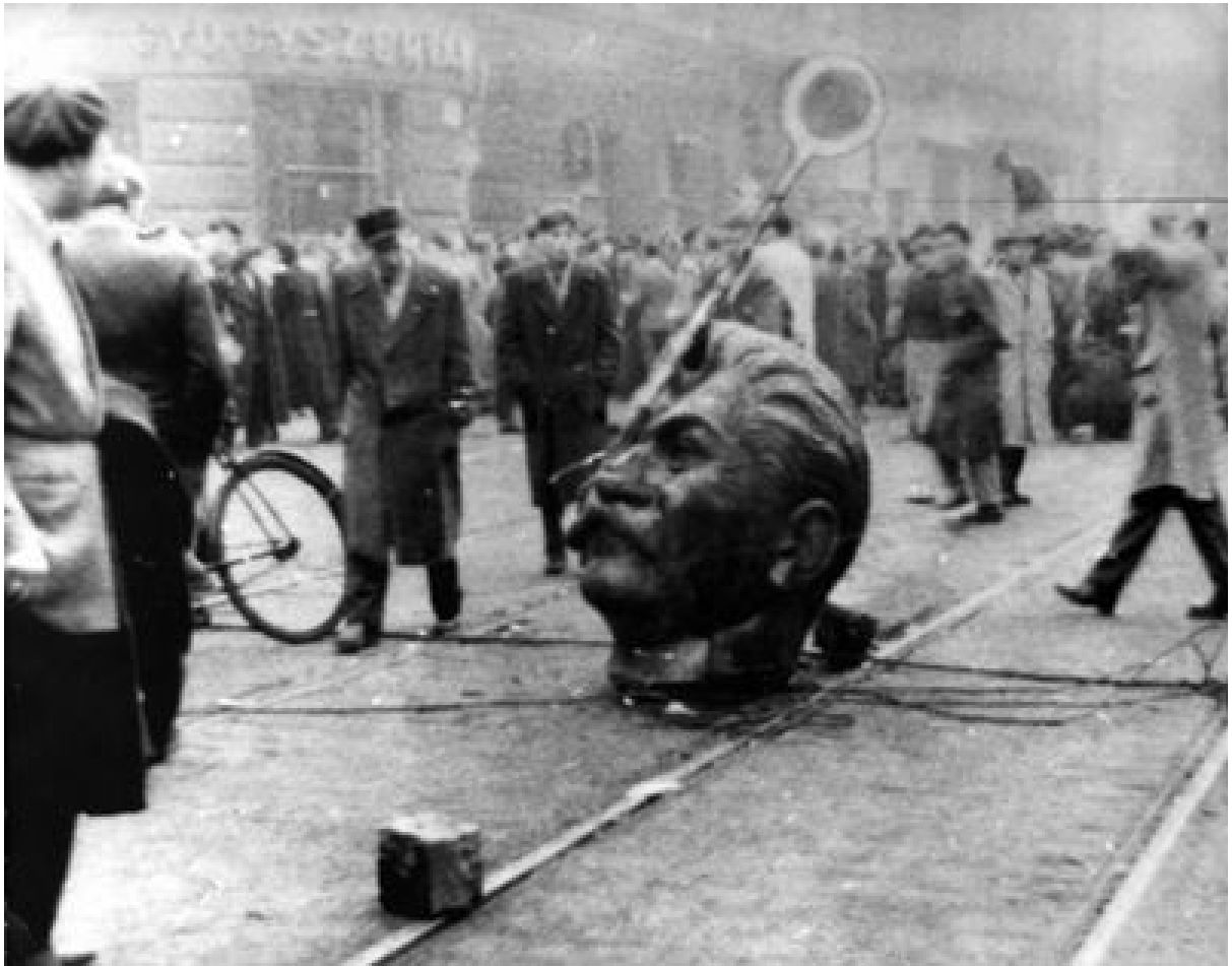
Standbeeld van Stalin, vernield tijdens de Hongaarse opstand, oktober-november 1956.