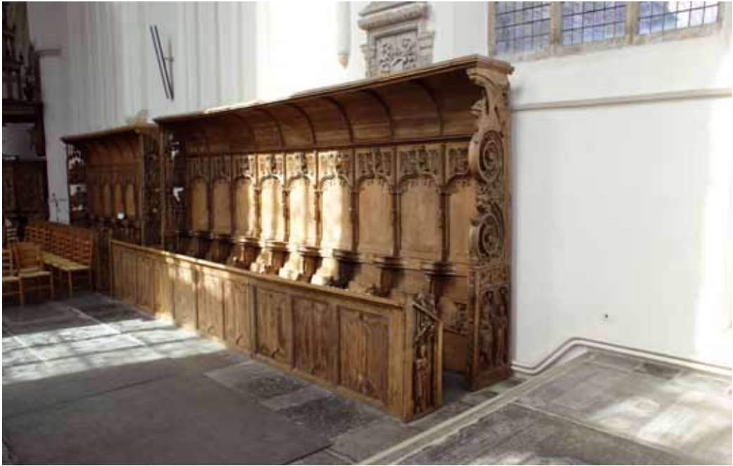
Koorgestoelte in de Martinikerk in Bolsward.