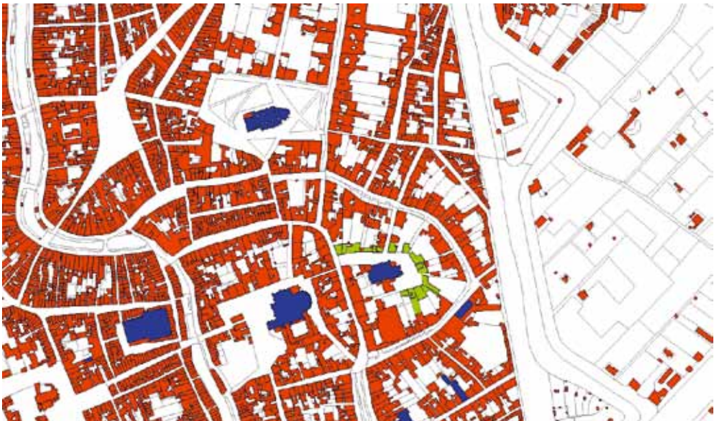
Huidige kadastrale kaart van het Kapittel Sint Pieter te Utrecht met de kanunnikenhuizen (groen).