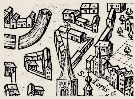
De immuniteit. (detailkaart: Braun en Hogenberg, 1588)