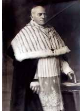
Vlaamse kanunnik in winterkoorkledij.