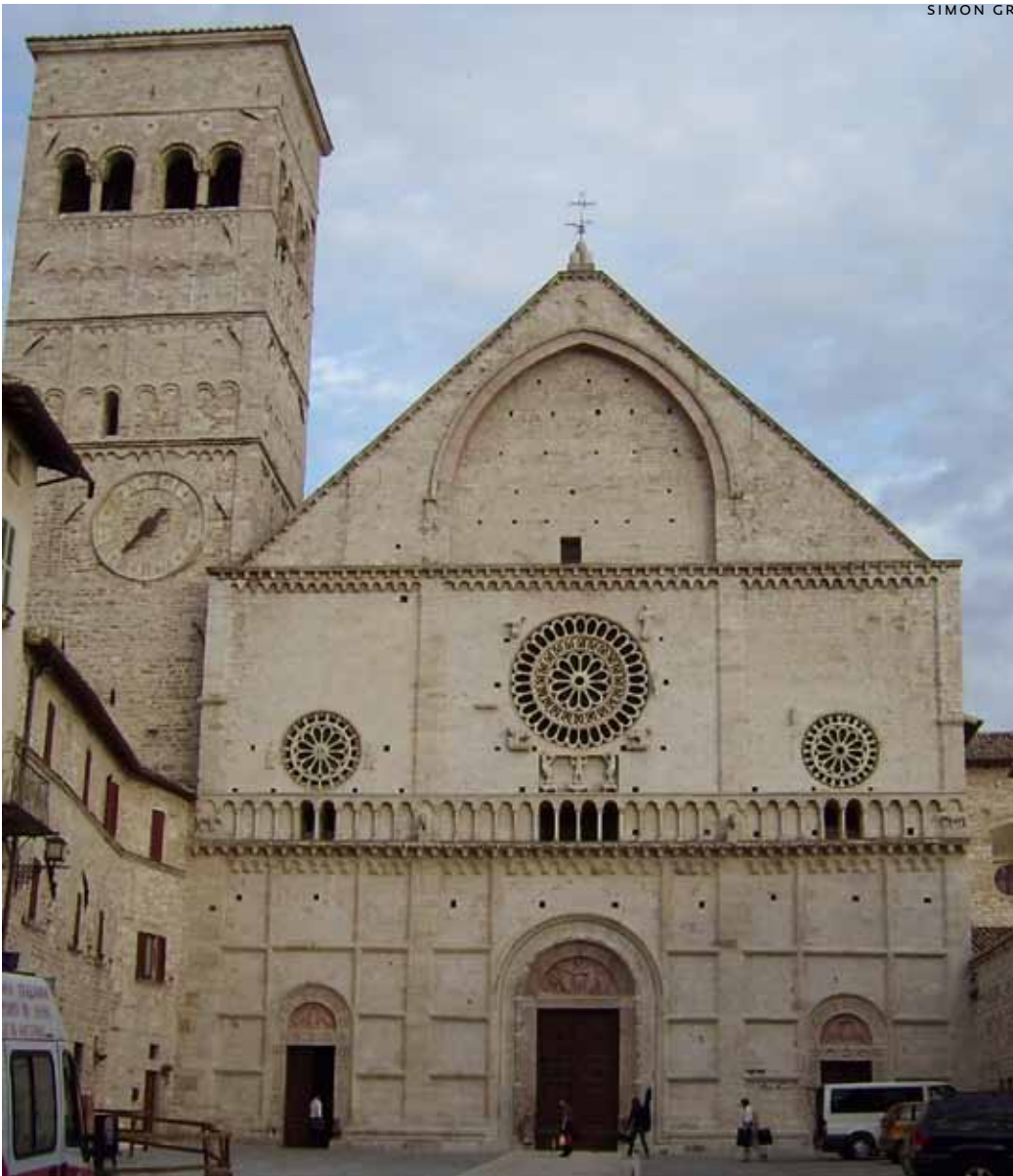
De 'Duomo di San Rufino' in Assisi.