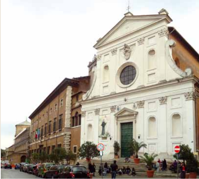
De kerk van het ziekenhuis 'In santo spirito' te Rome.

dan ook evident dat we hier met een en dezelfde persoon van doen hebben. Hieronder een overzicht van de vermeldingen in Archief Eemland. 61