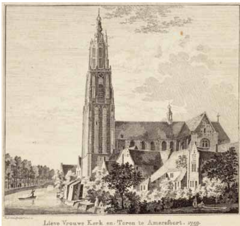
De O.L.V.-Kerk te Amersfoort.

nog altijd fier boven het oude stadscentrum van Amersfoort uit. Amersfoort was sindsdien tot aan de reformatie en zelfs nog daarna het belangrijkste bedevaartsoord in de noordelijke Nederlanden en had aantrekkingskracht op mensen van heinde en verre, zelfs van ver buiten de huidige landsgrenzen. 18