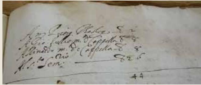
Tollius en Rinaldo del Mel samen op een betalingslijst.

elf stemmen voor en twee tegen, en dus zonder belemmering'. 29