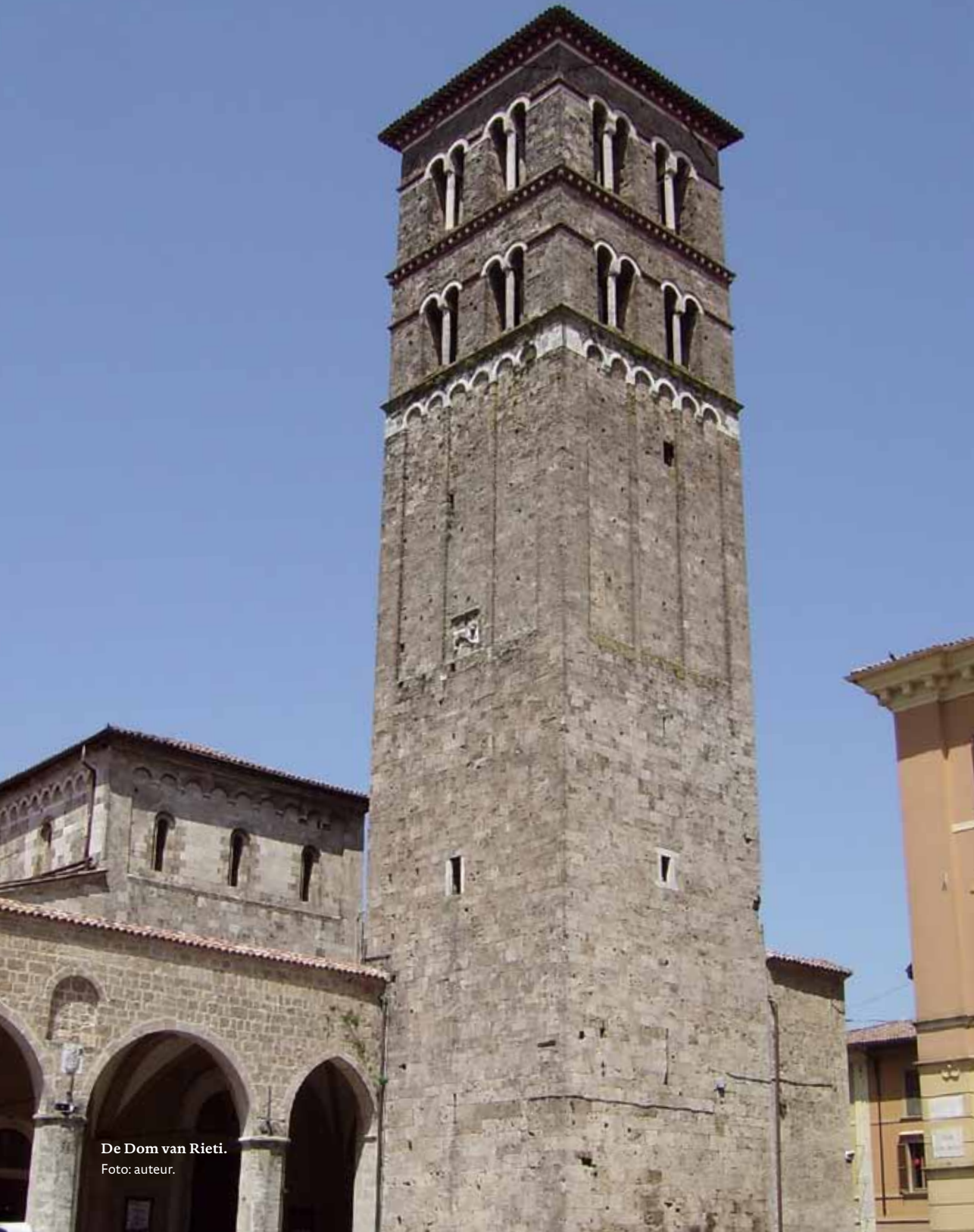
De Dom van Rieti.