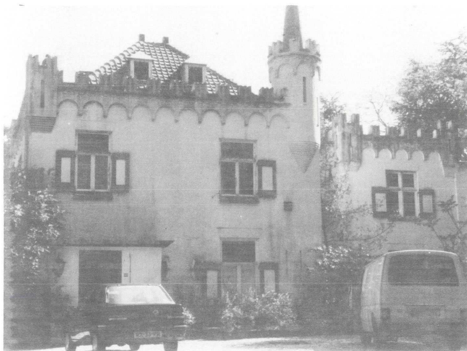
De "Witte Burcht" eind jaren tachtig in Soest