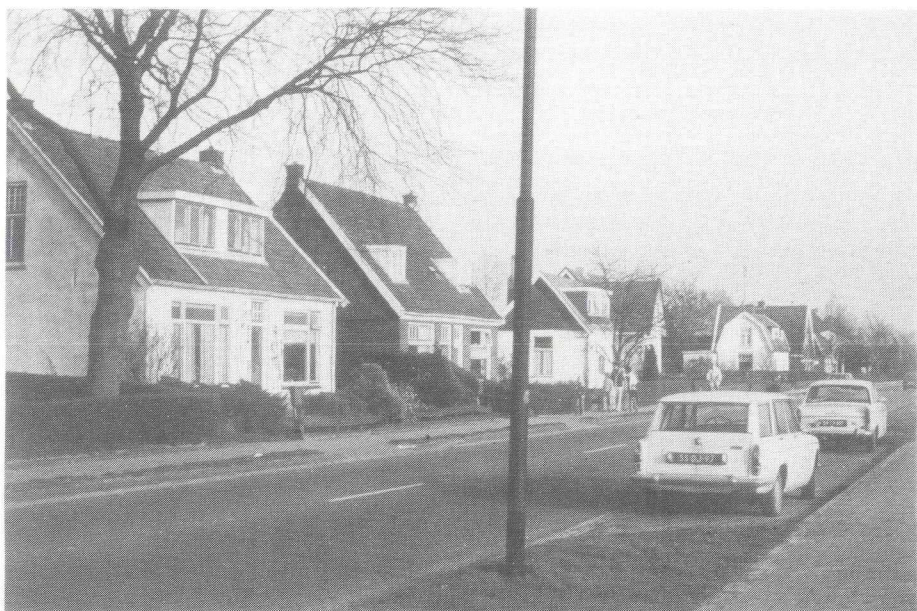
Laarderweg 108, het witte huis links op de foto

In de dertiger jaren moest Van Swieten enkele malen op herhaling en moest zich dan melden in Alkmaar waar hij instructie gaf aan de verbindingstroepen. Hij deed dat niet met plezier, want hij ergerde zich groen en geel aan het gebrek aan, en de slechte toestand van, het materieel.