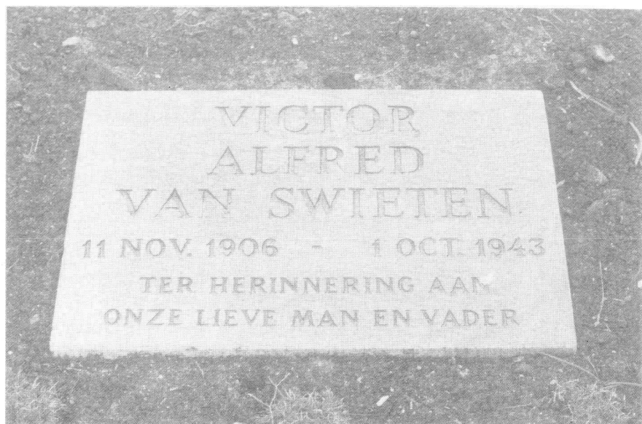
Graf van Victor Alfred van Swieten op de erebegravingplaats te Bloemendaal