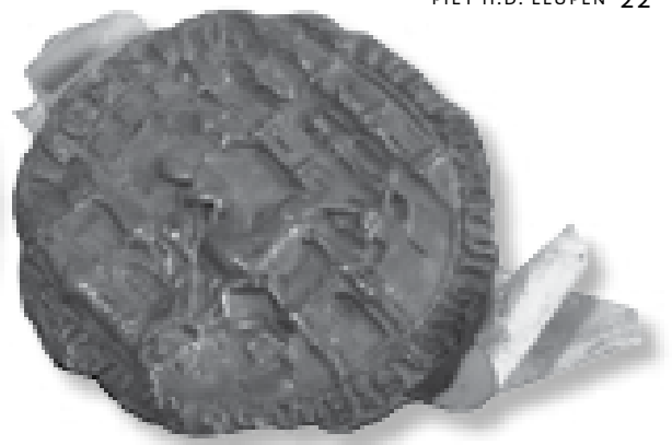
Het tweede zegelstempel van Amersfoort, 1367 (Museum Flehite).

schouten, nu blijktbaar de schout hadden gepasseerd en met de raden en de Utrechtse gemeente op een lijn stonden. Ook de meerderheid van de machtige kapittelheren van de vijf kapittels steunden deze overeenkomst met de rooms-koning. De positie van bisschop Hendrik van Vianden was sterk aangetast in deze jaren. Toch keerde in 1255 voor hem het tij. We weten niet precies wat er gebeurd is, maar tussen de rooms-koning en de stad kwam het tot een verwijdering, waarbij de stad weer overging naar de kant van de bisschop, tegen de zin van de kapittelheren en de rebellerende edelen. Het koopliedenbestuur in Utrecht kwam in de tweede helft van de 13 e eeuw dus in een moeilijke situatie terecht.