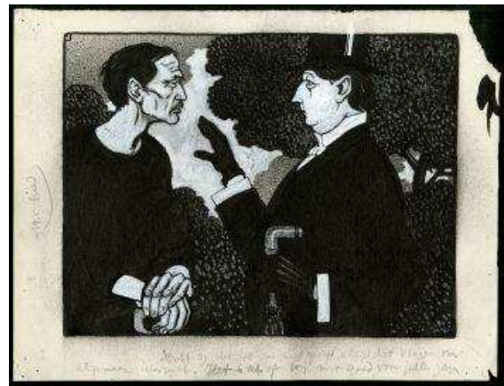
Figuur 8 Illustratie uit 1910 over uitbreiding van het kiesrecht. De ondertitel luidt: ‘Denkt ge dat het ons niet grieft, altijd dat vragen om algemeen kiesrecht. Het is als of wij niet goed voor jullie zorgen’

Het hierboven genoemde doel van het beschavingsoffensief om de verschillen in gedrag te vervlakken had nog een andere drijfveer dan enkel de bestrijding van de armoede. De toename van welvaart door de industrialisatie had namelijk niet alleen grote gevolgen voor de sociale stratificatie, maar ook voor het aantal kiesgerechtigden. Zoals bleek uit de paragraaf ‘Uitbreiding van het kiesrecht’ zorgde de kieswet van 1896 van Samuel van Houten er namelijk voor dat het kiesrecht gebonden werd aan de welvaart. Naarmate de welvaart voor een steeds groter gedeelte van de Nederlandse bevolking toenam, als gevolg van de voortgaande industrialisatie en de economische bloei die vanaf 1895 intrad en tot het begin van de Eerste Wereldoorlog duurde, kwamen er in het laatste decennium van de negentiende eeuw meer kiesgerechtigden. Het steeds verder uitbreidende electoraat vormde een reële dreiging voor diegenen die tot voor kort tot de kleine bevoordeelde groep gehoord