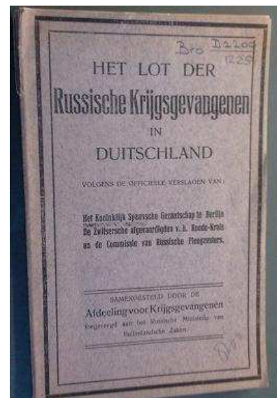
Figuur 4 Het vertaalde rapport over de toestand van Russische krijgsgevangenen in Duitsland (IISG)