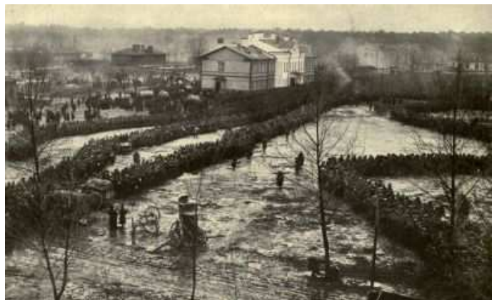
Figuur 3 Russische krijgsgevangenen in een Duits krijgsgevangenenkamp wachten in lange rijen op een maaltijd

krijgsgevangenen genomen Russen. De Nieuwe Rotterdamse Courant (hierna NRC ) melde op 1 januari 1916 bijvoorbeeld dat zij van het hulpcomité hadden vernomen dat deze in november 1915 aan de krijgsgevangenen in verschillende kampen in Duitsland en Oostenrijk-Hongarije hadden gezonden: ‘6.691 pakketten met levensmiddelen, voor het gezamenlijk bedrag van f 9.997, tegen 7.071 voor een bedrag van f 10.881 in October en 2.140 voor een bedrag van f