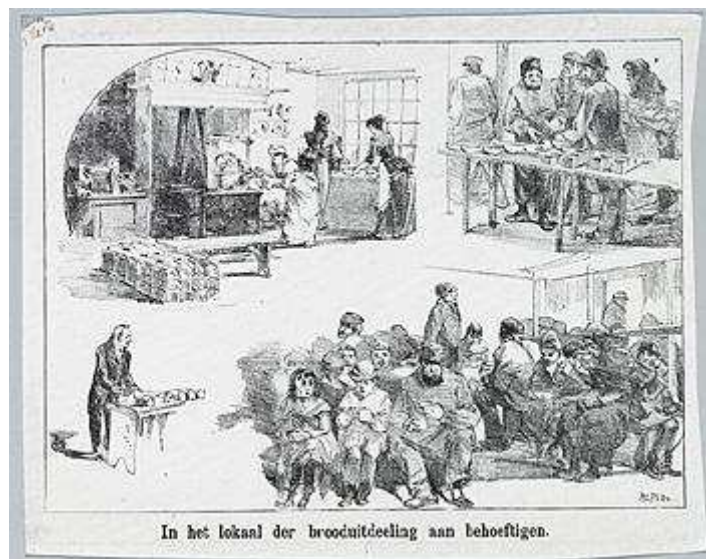
Figuur 7 Prent uit 1888 'In het lokaal der brooduitdeling aan behoeftigen'

Doordat de industrialisatie een grotere verscheidenheid voortbracht in de materiële positie van de onderste inkomenslagen van de Nederlandse bevolking, en het rijkere deel van de bevolking het gevoel had dat zij de verantwoordelijkheid hadden om als opvoeders op te treden, ontstond er tijdens de tweede helft van de negentiende eeuw een toenemende zorg voor armlastige burgers. Ten behoeve van de armlastigen werd in 1854 de Eerste Armenwet (de