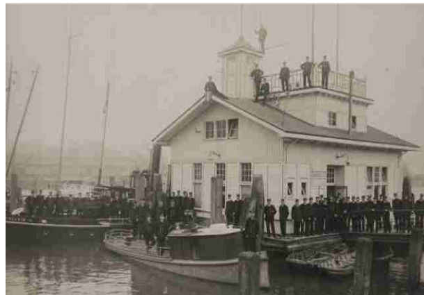
Figuur 11 Foto gemaakt tussen 1910 en 1920 van het voltallige personeel van de rivierpolitie, poserend bij en op het kantoor van de rivierpolitie in de Parkhaven

Een eerste maatregel om het meest onaangepaste gedeelte van de Russische vluchtelingen te scheiden van degenen die beter aan de maatschappelijke verwachtingen van ordelijkheid en zelfbeheersing voldeden werd in mei 1917 genomen. Er werd een isolatievaartuig afgemeerd in het midden van de Parkhaven. Internering aan boord van het vaartuig werd geregeld door de vreemdelingenpolitie, terwijl de rivierpolitie in een drijvend kantoor naast de boot werd belast met het toezicht. Dat deze maatregel niet als permanente oplossing werd gezien bewijst het rapport van de gemeente Rotterdam van 23 juli 1917. Hierin staat een verzoek van de gemeente aan de minister van Binnenlandse Zaken om, wanneer het niet mogelijk bleek om alle Russen in één kamp onder te brengen (dit leek de gemeente de enige afdoende maatregel), in ieder