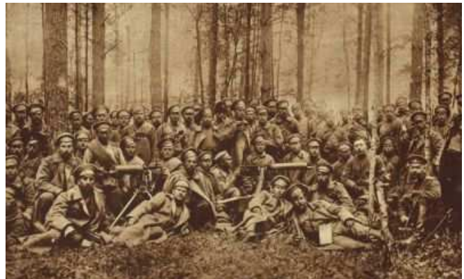
Figuur 10 Een groep Russische infanteristen

De infanterie van het Russische leger dat in 1914 ten strijde trok bestond hoofdzakelijk uit boeren. Volgens de auteurs van het artikel A Nation at War: the Russian Experience was het Russische doel andere gebieden onder de hegemonie van het Slavische volk te brengen voor deze boeren niet te bevatten. Door de Russische soldaten werd de oorlog dan ook gezien als een iets dat zij niet konden begrijpen, maar meer als