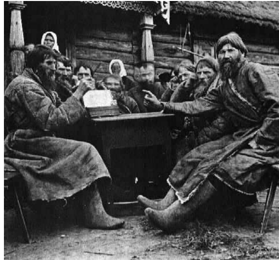
Figuur 9 Foto van Russische boeren, gemaakt aan het eind van de negentiende eeuw

Grote (regeerde van 1762 tot 1796), zorgden ervoor dat Rusland steeds serieuzer genomen moest worden op het gebied van de internationale politiek. Catharina de Grote heeft bovendien geprobeerd een aantal verlichtte ideeën over te brengen naar Rusland. Hiervoor, en vanuit persoonlijke interesse, correspondeerde zij gedurende bijna haar hele leven met bekende filosofen als Voltaire en Diderot. Hoewel Catharina op basis van geschriften van Diderot een hervorming van de Russische wetgeving voorstelde kan zij echter niet als verlicht gezien worden. De wetsvoorstellen verbeterden namelijk vooral de positie van de adel en gaf hun volledige controle over hun lijfeigenen en landgoederen. De Nederlandse beeldvorming van Rusland veranderde door de modernisering van de tsaren echter wel in positieve zin. Zoals Naarden zegt is er tot 1850 geen vorm van russofobie te herkennen in Nederland, ook bestond er weinig angst meer voor de gevaren van een groot Russisch rijk. 38 Dit zorgde er echter niet voor dat het oude beeld van een chronisch gebrek aan beschaving onder het Russische volk verdween.