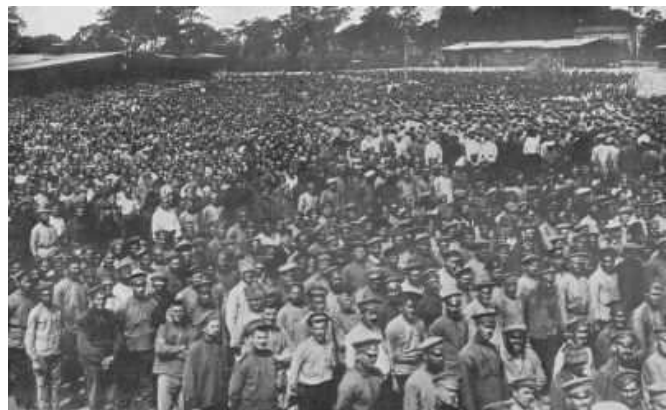
Figuur 2 Russische krijgsgevangenen in een Duits krijgsgevangenkamp ( http://www.gwpda.org/ )

De krijgsgevangenenkampen in de oorlogsvoerende landen waren doorgaans overvol en de leefomstandigheden waren zeer slecht. De krijgsgevangenen waren er ook overgeleverd aan de willekeur van hun bewakers, aan honger, slecht weer, slechte hygiënische omstandigheden en zelfs aan gevaarlijke epidemieën. Er waren in de kampen echter ook groepen die konden rekenen op een