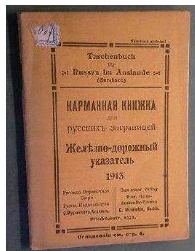
Figuur 1 Handboek voor Russen in het buitenland

De Russen waren één van die verschillende nationaliteiten die zich tijdens de Eerste Wereldoorlog in Nederland zouden vertonen. Veel Russische militairen die uit Duitse krijgsgevangenenkampen waren gevlucht zochten de snelste weg richting het neutrale Nederland, maar ook Russische burgers kwamen vanuit de omringende (eventueel vijandige) landen Nederland binnen. De Russen die tijdens de Eerste Wereldoorlog naar Nederland kwamen, waren echter niet de eerste Russische vluchtelingen die hierheen zouden trekken. In de jaren tachtig van de negentiende eeuw zochten namelijk al veel uit Rusland afkomstige joden hun toevlucht in Amsterdam en Rotterdam. De reden dat veel Russische joden naar het westen trokken was de afkondiging van de zogenaamde mei-wetten in 1882. Deze wetten vormden het begin van een reeks antisemitische maatregelen die Alexander III en diens