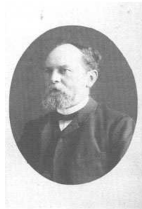
Figuur 6 Samuel van Houten

Deze wilde een vertegenwoordigend stelsel waarin parlementariërs in volledige vrijheid hun conclusies konden trekken. Niet de koning maar de ministers werden verantwoordelijk voor het beleid, daarnaast zou de Tweede Kamer veel meer invloed krijgen en bovendien direct gekozen worden (echter wel door een beperkte groep kiezers). Vanaf de grondwetsherziening van 1848 zouden de politieke verhoudingen voorgoed veranderen, dit zou echter ook grote maatschappelijke gevolgen gaan hebben. Vooral vanaf de jaren zeventig en tachtig van de negentiende eeuw ontstonden er nieuwe, goed georganiseerde politieke groepen die zich anders gedroegen dan de gegoede burgerij gewend was en het debat rond algemeen kiesrecht deden oplaaien. 22