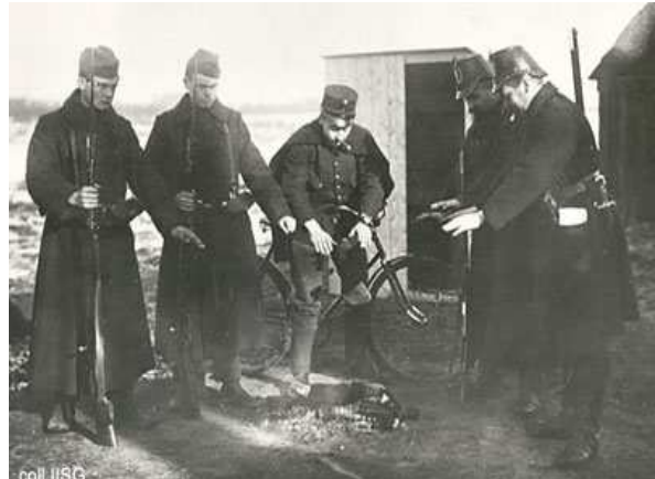
Figuur 5 Duitse en Nederlandse grensbewaking tijdens de Eerste Wereldoorlog

Veel krijgsgevangenen waren niet van plan hun tijd uit te zitten in de kampen. Als de beveiliging het enigszins toeliet waagden zij een ontsnappingspoging. In de kampen in Groot-Brittannië was de bewaking zeer streng, hierdoor was er nauwelijks mogelijkheid om te ontsnappen. Indien een ontsnappingspoging toch slaagde, dan was het praktisch onmogelijk om de Noordzee over te komen. Er hebben zich in Nederland dan ook weinig ontvluchte Duitse of Oostenrijkse krijgsgevangenen gemeld die uit kampen in Groot-Brittannië afkomstig waren. De krijgsgevangenen in Duitse kampen hadden minder problemen met het vijandige land ontvluchten wanneer zij eenmaal ontsnapt waren. Britten, Fransen, Belgen, Russen en Polen vluchtten na een succesvolle ontsnappingspoging vaak naar de grens van het neutrale Nederland. Het doel was vanuit Nederland verder te reizen naar hun vaderland, eventueel om zich weer in de strijd te kunnen mengen. De oorlog zorgde er echter voor dat de mogelijkheden om internationaal te reizen beperkt waren, hierdoor werd het grootste deel van de vluchtelingen gedwongen om langer, en soms gedurende de hele oorlog, in Nederland te blijven. 14