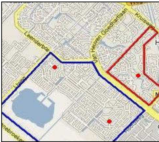
Figuur 3.4: Accommodaties in Toolenburg (De Veste links, De Amazone rechts) en Pax.

Toolenburg woonachtig is. Het wijst in ieder geval op een meer individualistische levensstijl dan die van de bewoners van de andere groeikernwijken. De bewoners voelen zich desondanks in hoge mate verantwoordelijk voor de leefbaarheid van de buurt. Zij beoordelen deze gemiddeld met een 7,6 (Ibid.).