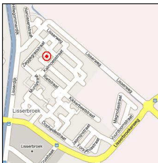
Figuur 3.5: Het dorps huis in Lisserbroek.

Ongeveer een kwart van de bevolking van Lisserbroek is geboren en getogen in de gemeente Haarlemmermeer. Veel mensen blijven na verhuizing ook in deze kern wonen. Dit heeft grote invloed op de sociale cohesie in het dorp: ruim 35% van de bevolking beoordeelt de sociale cohesie als sterk (Gemeente Haarlemmermeer, 2003, p. 9-11). Met een score van 6,5 is dit het hoogste van dit wijctype. De bewoners zijn redelijk gehecht aan de kern waarin ze wonen.