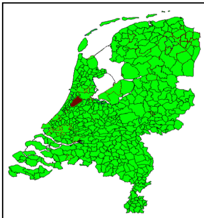
Figuur 3.1: De gemeente Haarlemmermeer (bruin) op de overzichtskaart van Nederlandse gemeenten.

De gemeente Haarlemmermeer is met ruim 140.000 inwoners, verspreid over 26 woonkernen in een gebied van 18.500 hectares, één van de grootste gemeenten van Nederland. Hierdoor heeft de gemeente veel weg van een regio (Kruythoff, 1997, p. 112). Figuur 3.1 geeft aan waar deze gemeente in Nederland ligt. De naam van de gemeente verwijst naar het Haarlemmermeer, dat ongeveer honderdvijftig jaar geleden werd drooggelegd met stoomgemalen om nieuw land te creëren. Rondom de gemeente ligt een 62 kilometer lange ringvaart. Deze is rond dezelfde tijd met de hand uitgegraven door arbeiders uit de directe omgeving en uit Friesland en Noord-Brabant (Gemeente Haarlemmermeer, 2002a, p. 4). Deze arbeiders bouwden vervolgens op het nieuwe, drooggelegde land en langs de ringvaart hun eigen boerderijen, zoals zij dat thuis gewend waren. Hierdoor ontstond een diversiteit aan woningbouw en werd de gemeente een agrarische gemeenschap.