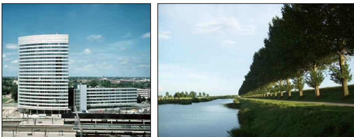
Figuur A en B: De kantoorpanden naast het centraal station van Hoofddorp (links), die mij het zicht op de Geniedijk (rechts) net ontnamen.

Van maart 2008 tot oktober 2009 was ik woonachtig in Hoofddorp, gemeente Haarlemmermeer. De diversiteit die deze gemeente kent, sprak mij direct aan. De gemeente is landelijk en uitgestrekt over een groot aantal hectare, maar tegelijkertijd ook het toonbeeld van drukte en bedrijvigheid met Schiphol vlakbij en veel industrie in het stedelijke gebied. De omgeving waar ik woonde, lijkt hier het toppunt van te zijn: tegenover het centraal station van Hoofddorp, op een terrein dat is omringd door grote kantoorpanden. Zodra ik echter onder het station door liep, kwam ik terecht in een open landschap met schapen, eenden en roofvogels en kon ik zo de hele Geniedijk over lopen richting de Haarlemmermeerse Ringvaart bij Aalsmeerderbrug, zie figuur A en B.