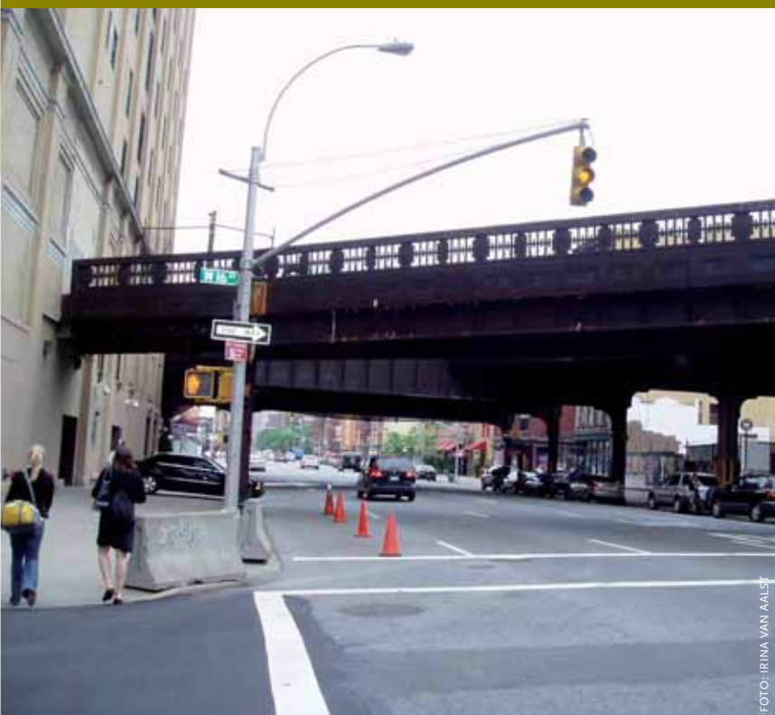
De High Line, de 2,5 km lange en 11 meter brede verhoogde spoorlijn door de Far West Side, is al jaren niet meer in gebruik maar wel beeldbepalend voor de wijk.