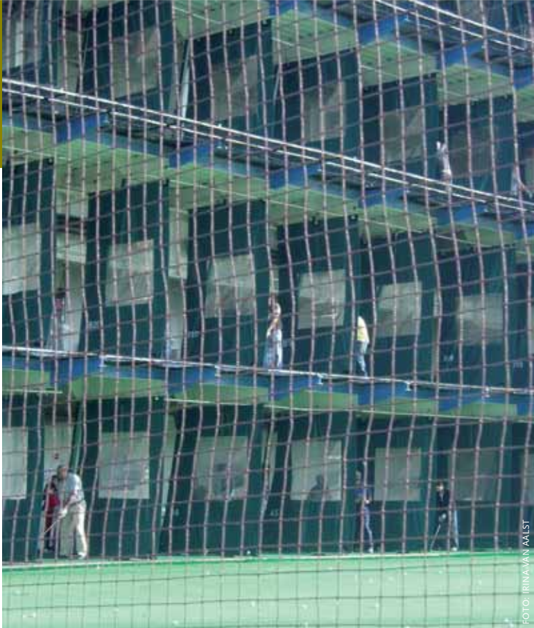
Waar vroeger oceaanstomers aanmeerden zijn de Chelsea Piers nu in gebruik als overdekte ijsbaan, fitnesscentrum en een driving range voor golfers van vier verdiepingen.